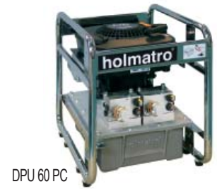
DPU 60 PC