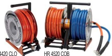
HR 4420 CLO