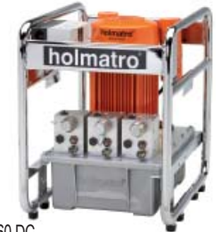
MPU 60 DC