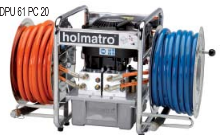
DPU 61 PC 20